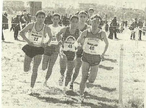
RISULTATI E' sicuramente un buon momento per i podisti maremmani che si preparano anche al «Vivicittà»